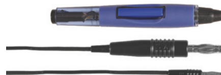
180-700 Uchwyt igieł epilacyjnych, Ø 1.25 mm typ-F, roziłączny kabel, długość 1.5 m, wtyk 4 mm